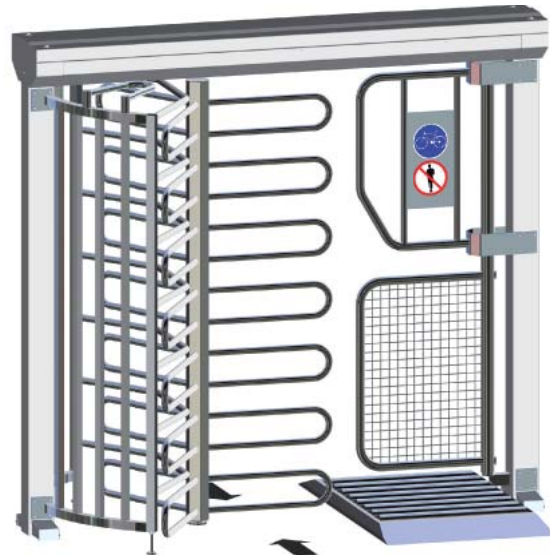
Ecco 120 BF mit optionaler Rollenbatterie